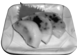
◎新キャベツとカニの酢のもの

〔ひと手間かけた春の味〕 ゆでタケノコを厚さ1センチほどの輪切りか半月切にし、煮汁(だし汁、みりん、淡口しょうゆ)で下煮し、味をふくませ、汁を切っておく。白みそ、みりん、砂糖、酒を小鍋で焦がさないように練り、火からおろし、少し冷めたところへ卵黄を加え、手早くまぜ、軽く火を通す。アルミホイルを広げ、タケノコを並べ、練りみそをかけ、オープンやグリルで、少しあぶって、焼き色が付いたら出来上り。