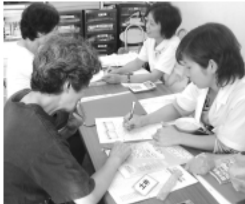
政府管掌健康保険(健康保険証)の発行が、〇〇社

4月から実施される新しい健診制度(特定健診・特定保健指導)は、機関紙2月号でも紹介しましたが、ヘルスコープおおさかは、「新組合員健診」「新半日ドック」に取り組みとともに、企業・事業所健診を積極的に推進し、さらに生活習慣を改善し健康づくりをすすめる保健指導の活動を強めます。