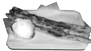
◎グリーンアスパラガスの天ぷら

〔一本長いまま、子どもも大喜び〕 アスパラは根元のかたい部分を切り取り、天ぷらの衣をつけて、180℃の油で揚げる。鍋が小さい時は半分に分けてください。