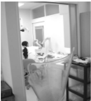
準個室化した治療スペース

は、建設を心待ちにしていた患者さんや地域の皆さんが訪れ、診療予約をする人もいました。なお3階には組合員ルームがあり、地域組合員の期待を集めています。