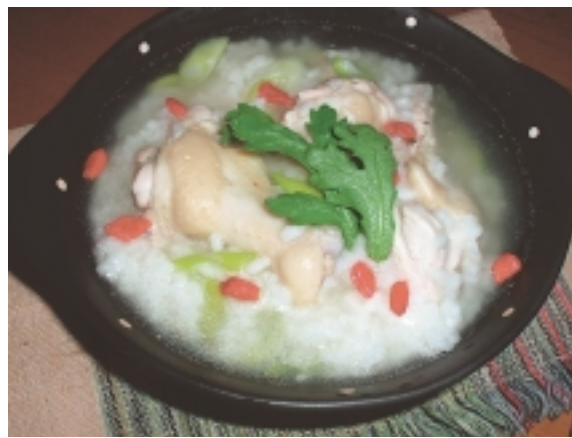
お手軽骨付き鶏肉 サムゲタン