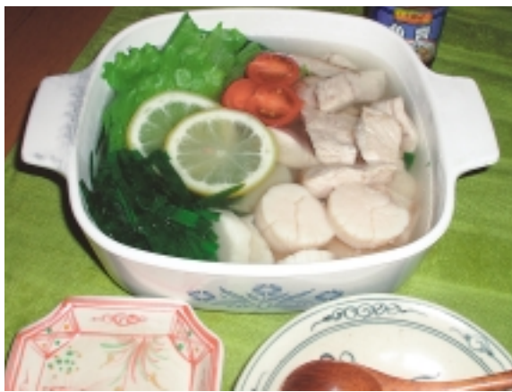
白身魚の エスニツク鍋

作り方 ①魚は一口大に切り下味をつけ、帆立は厚みを半分に。セロリは筋を取り斜め薄切り、ニラは4~5cmに切り、レタスは食べやすい大きさにちぎる。