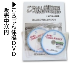
「ころばん体操」DVD 販売中500円