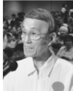
発言する戸板総代 (生江支部)

6月27日 (日)第11回 通常総代会が 総代439名 (内書面によ る出席28名) オブザーバー 等、合計69