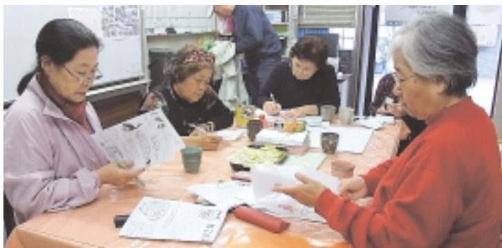
新聞作り。下の写真は『ねこのらくがき』

いろいろな自慢人もたくさん集まります。おしゃべりをしている事があります。その時は私の出番です。どうぞお入り下さい。一緒に日向ぼっこでもしましょうよ」と、お誘いするので近所の方は玄関先にお花を植えて下さい。ボランティアグループ「つぼみ」には、地域での見守り活動の依頼もきます。男性も気軽に来て欲しいと思っています。男の料理教室を開いたり、男性のボランテアにもこだわりたいです。まだまだ幼い私ですが、あなたが居てくれて良かったと言ってくれる人が増えています。私は思うんです。こんなゆつくりと日向ぼつこの出来る場所がたくさんあったらいいなあって、夢はいっぱい広がります。