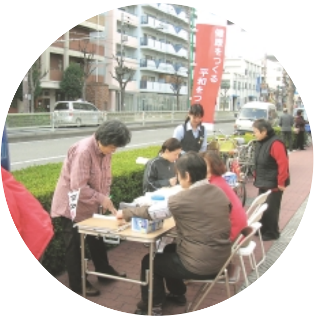
赤川・都島支部はスーパー前の健康チェック

11月も「風が冷たいから、受診する人おらんのとちがう？」という運営委員の心配をよそに、あつという間に椅子が足りなくなり、1時間が血圧・体組成のチェックが16名、大腸ガン検診セットは8名が受け取られ、「取りに伺いますよ」と声をかけると「こんなに親切にしてもらって、ありがとうございませ」と頭を下げられる方も。数ヶ月前、ここで加入された方は、今こらばん体操サークルにも入って、毎週楽しんでおられます。