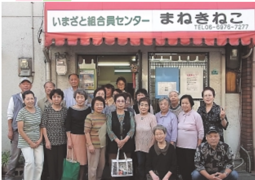
「まねきねこ」1周年に集まったみなさん