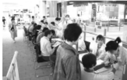
イオンモールで健康チェック

世界保健デーに合わせて、全国の医療生協で街頭健康チェックが行われました。ヘルスコープおおさかも4月5日、3カ所に分かれて行い、組合員さん、職員合計70名が参加し、100名近くの健康チェックを実施。署名も70筆集めました。鶴見区のイオンモールで行ったチェックでは新入職員も参加し、買い物客へ