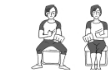
左手をグーにして前へ、足を開く 右手をグーにして前へ、足を閉じる