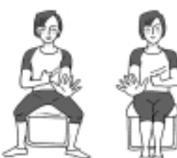
左手をパーにして前へ、足を開く 右手をパーにして前へ、足を閉じる