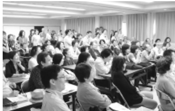
高齢者訪問スタート集会

役割」と題して組合員・職員1100名が学習。「医療福祉生協の存在そのものがまちづくり。まちづくりの主役は高齢者です」とのお話にて、元気をもらって、組合員・職員がひとつになり75歳以上の組合員を中心に地域訪問対話活動をスタートさせました。