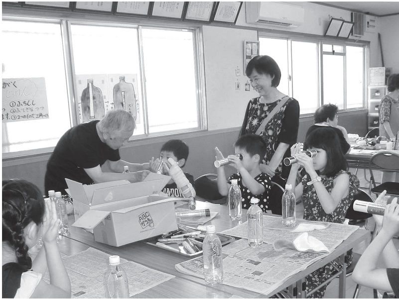
のえ地区「夏休み子ども教室」