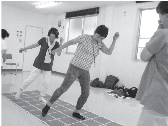
今津地区スクエアステップ