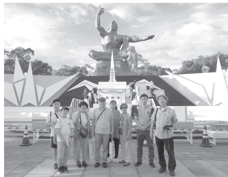
組合員代表団のみなさん

毎年行われている長崎の原水爆禁止世界大会に、ヘルスコープから総勢21名の代表団が参加しました。8月7日の開会式には全国から4000人の参加、9日の開会式には5000人が集まり、21ヶ国政府代表が核兵器廃絶への決意を表明。日本の原水爆禁止運動を世界的に発展させることができた大きな大会になりました。 参加した代表団はそれぞれ分科会に別れ、被爆者の方から原爆投下の凄惨な話を聞いた。佐世保基地の軍港や、市内に残る被爆の痕跡を見て回りました。一瞬にして平和な生活を奪い、大切な人を殺してしまつた核兵器は世界から無くさないといけない。「いのちを守る私たちは戦争をゆるぎない」という思いを強く持つことができません。 薬についても長期間の投薬が社会的な問題になっています。ご自分で服用管理できる方はいいので