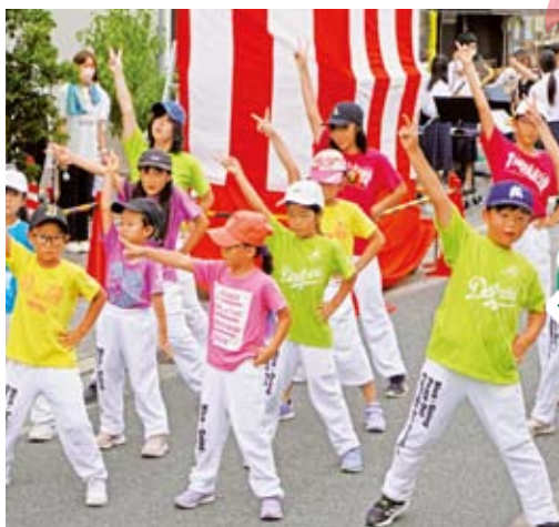
あかがわ地区生江DEワイワイ元気まつり