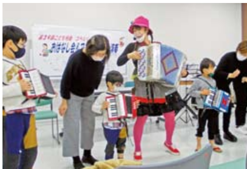
みんなでアコーディオンを演奏