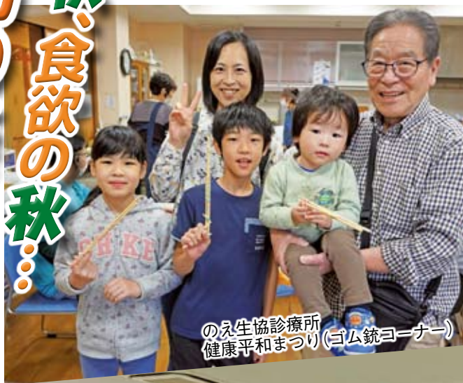
のえ生協診療所 健康平和まつり(ゴム銃コーナー)