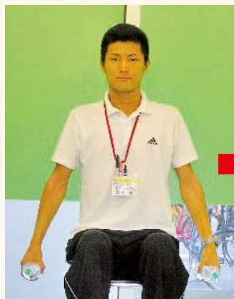
スタートポジション