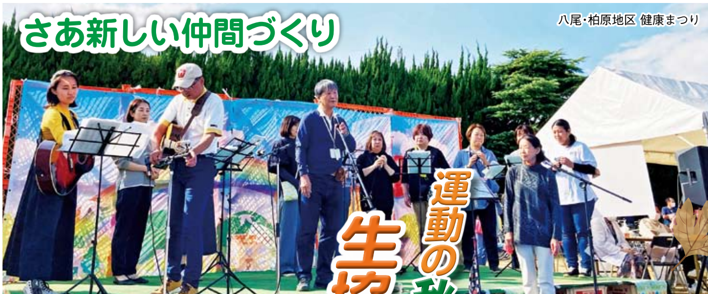
八尾・柏原地区 健康まつり

「liaison」とは、フランス語で「結びつき」や「連絡」を意味する言葉。この機関紙が仲間同士の連携・絆となることを願って。