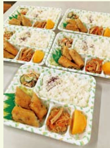
手作り春巻き、美味しそう

組合員さんの手作りのバランスの良いお弁当を「楽しみに待っています」という利用者さんのご様子も配達者が確認。何かあればすぐ関係者に連絡がとれるよう、見守りも兼ねた配食システムです。