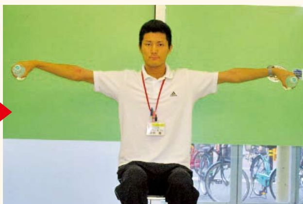
痛みがある場合は、ムリせず上がる位置までOK