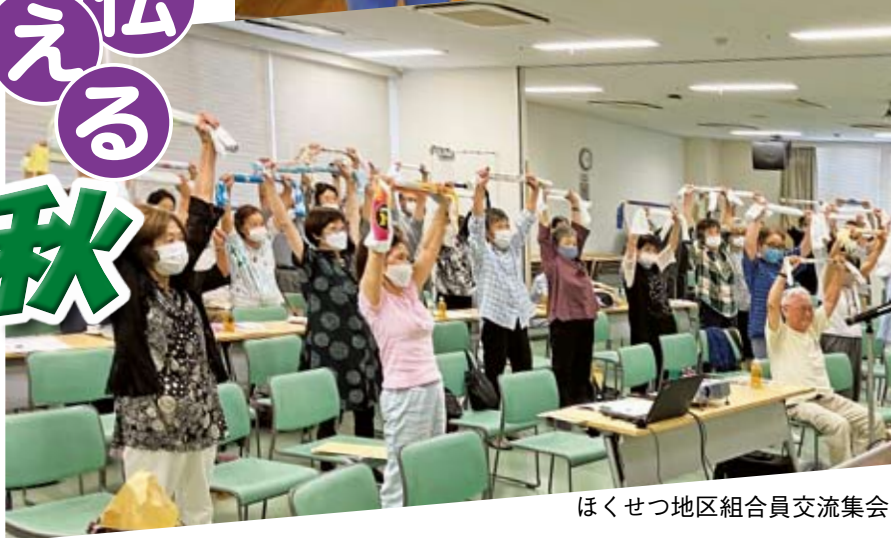
ほくせつ地区組合員交流集会