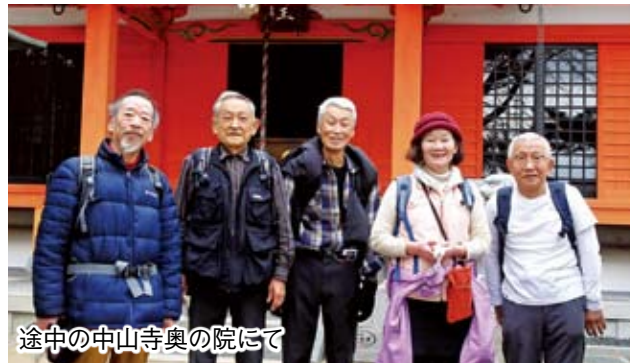
途中の中山寺奥の院にて