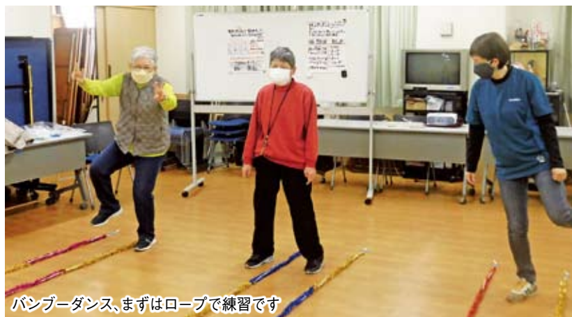
バンブーダンス、まずはロープで練習です