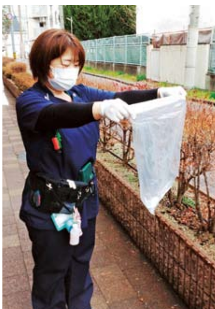
東大阪生協病院地区

東エリア生協病院地区や北エリアこぶし通り地区では禁煙外来の開設を機に、地域におけるタバコのポイ捨てをなくす活動をスタートしました。近隣各位への協力呼びかけなどを通じ、ごみ拾いウォークとして地域活動に発展させたことに