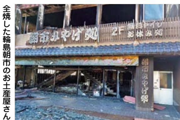
全焼した輪島朝市のお土産屋さん

所ではデイサービスを行っていません。発災当初は職員さんたちが「輪島で暮らしているのだから生活をしていて、診療所としては「デイサービスの継続は難しい」という判断をされたそうです。 しかし「ここで利用者さんたちのためにデイサービスを再開したい」という職員さんたちの想いがあり、2月7日からデイサービスを再開することができました。すると利用者さんから「デイサービスの再開を待っていた」と言われ、職員も元気をもらったという話をしていた。き胸が熱くなりました。