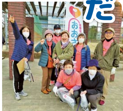
今津ごみ拾いウォーク