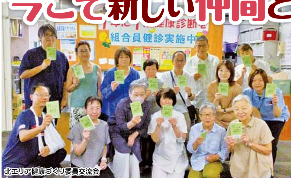
北エリア健康づくり委員交流会