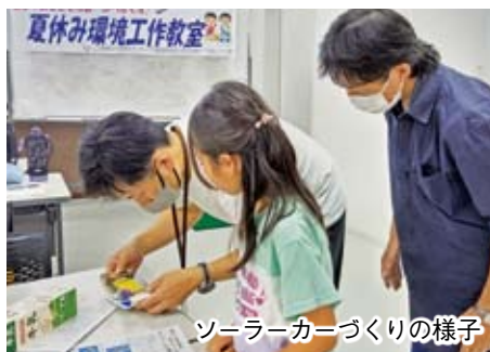
ソーラーカーづくりの様子

関心を持ってもらうことを目的にしています。車体には廃棄ダンボールを使い、車軸には竹串と竹筒、プーリーは厚紙とゴムをサンドイッチにしてしっかりと接着、電池ボックスは画用紙とアルミホイル、車体カバーは牛乳パックを利用しています。