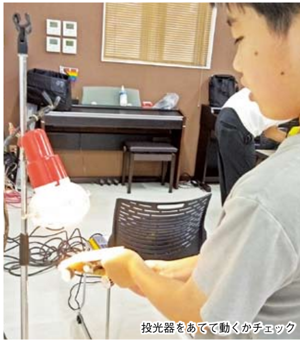
投光器をあてて動かすチェック

このソーラーカーは①太陽電池の働きを知る②非石油素材や廃棄物を使う③子どもたちにとって作りやすくてかわいい④環境問題に 子どもたちは、考案者の説明を聞いて、部品を組み立てていきます。わからないところは、スタッフさんが丁寧に教えてくれます。