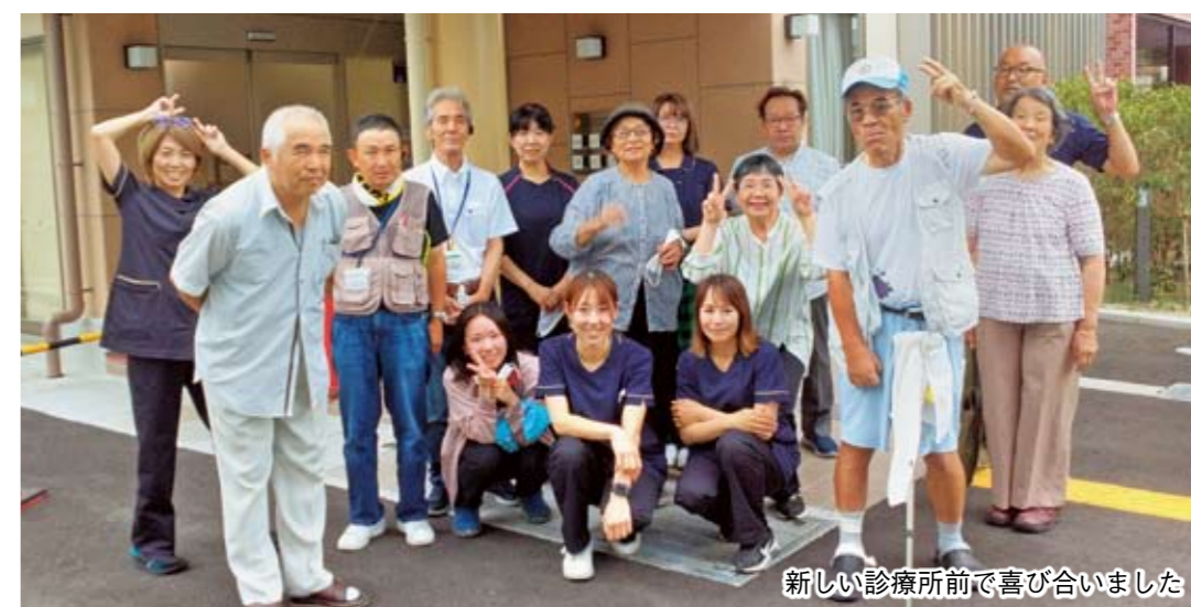
新しい診療所前で喜び合いました