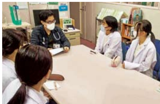
現役医師に高校生が直接質問

● ドラマでよく見かける手術室に入ると圧倒されて、迫力があって楽しかったです。今回のことを思い出ではなく、実現させられるようにがんばっていきましょうと思いました。(高校3年生)