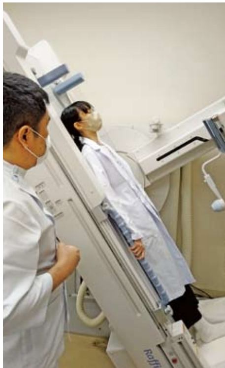
胃透視検査を患者さんの立場で体験

● 皆さんコミュニケーションを大切にしました。働いている人同士でも、患者さんに対してでも対等な関係作りを意識