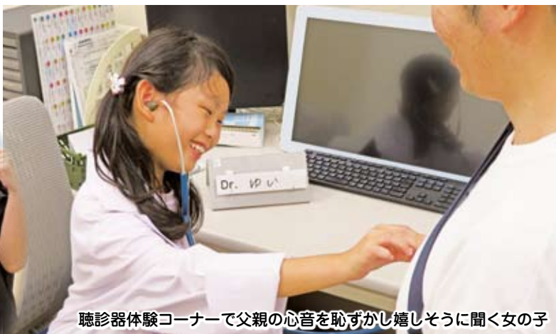
聴診器体験コーナーで父親の心音を恥ずかしがりそうに聞く女の子