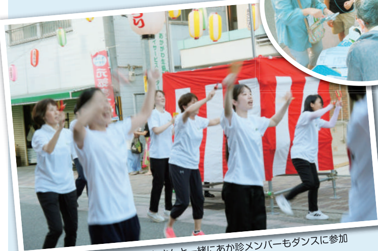
地域の介護事業所連絡会のみなさんとあか診メンバーもダンスに参加

▲あかがわ診療所前がメインステージ ◀子どもコーナー、握力チェックコーナーに120人以上! ▼毎年恒例の組合員さん手づくり「すこしおでん」が好評