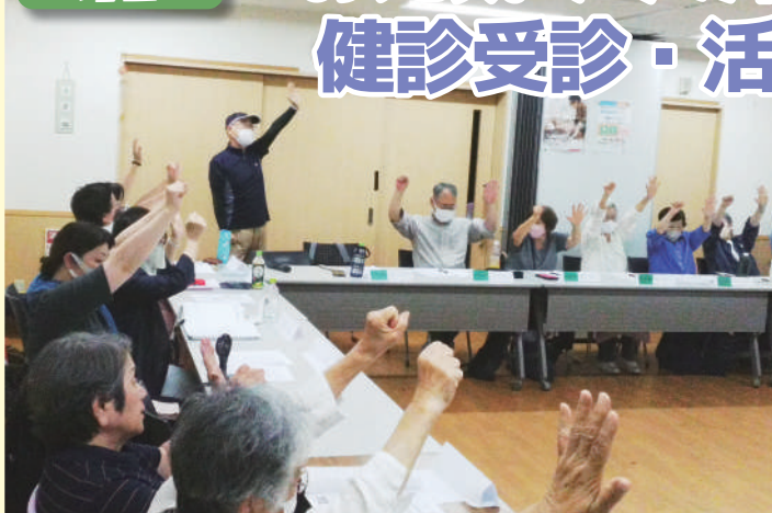
集会はほくせつ地区若井地区運営委員の頭の体操でスタート

あかがわ生協診療所2階組合員ホールで開催しました。コロナ禍もあり、今回ようやく北エリア内の地区運営委員が初顔合わせをし、そして経営課題について認識を統一して、各地区で生協強化月間を頑張るための集会として開催しました。 参加者のみなさまから「もっと交流し色々な活動ができるようにしたい」という声もいただきました。今後、各地区の運動がより広がるような取り組みを重ねていきます。