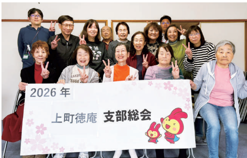
地域の仲間と一緒に