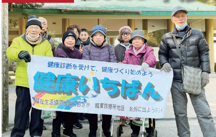
新春初詣ウォーキング

2025年度は、城東診療所2階「ミニミニティール」を地域に開放、診療所の敷居を低くし、診療所ごと地域に溶け込むようなことを地区で考えてきました。