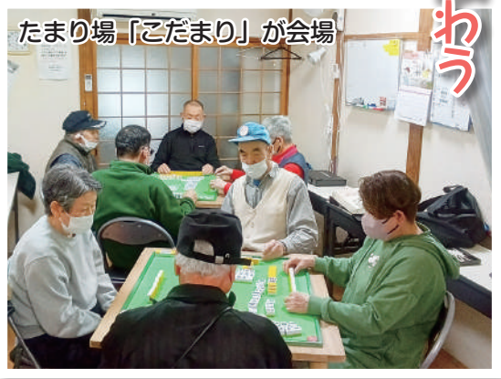
たまり場「こだまり」が会場

現在は、たまり場の「こだまり」にて2卓で回っていますが、待ち時間や参加人数の増加を考え3卓への変更が検討されています。さらに月1回初心者コースも新設され、今後の活動がより一層活発になる予感があります。