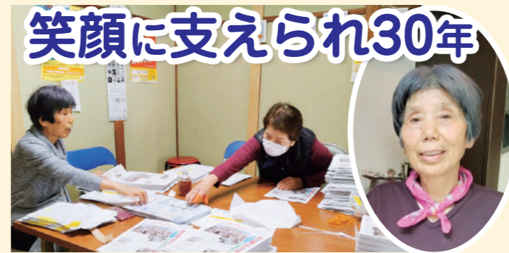
チラシの折り込み作業

生駒山の麓にある日下支部の組合員は現在約1300名います。私は日下支部運営委員を担い、機関紙の配布に関わって30年近くになります。