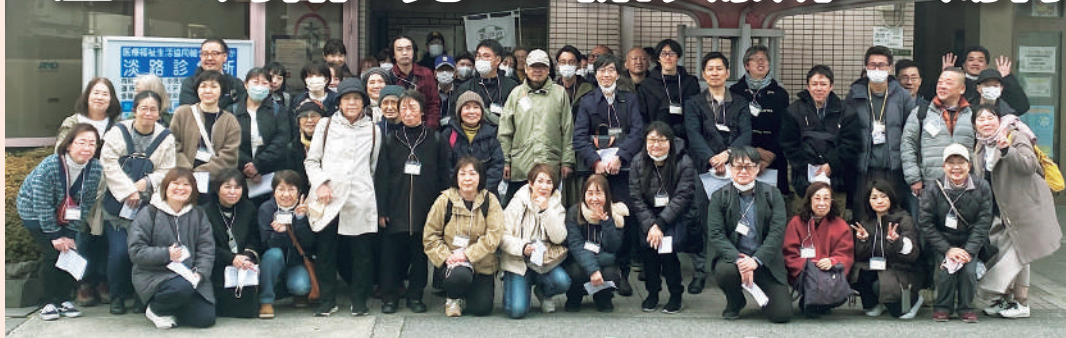
淡路診療所前で集合写真

淡路診療所のこぶし通り診療所への移転統合が行われ、4月より新しく「淡路こぶし通り診療所」がスタートしました。淡路地区には、淡路診療所を利用していた組合員さんも