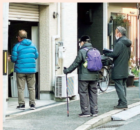
組合員訪問の様子

多く、引き続き新診療所を利用する方が多い一方で、「通院が遠くなる」「送迎などあれば…」などの声も聞かれていました。そうした不安の声に対応できるよう、1月末から始まった訪問行動。3月14日まで、計4回実施しました。地元の淡路・こぶし通り地区だけでなく、他地区・他エリアからも組合員と職員が参加し、4回の訪問では1,500件の組合員宅を訪問し、約700の方と対話をすることができました。他地域から参加された方からは、「対話した方々、みなさん対応が温かかった」との声が多数寄せられました。法人全体で取り組んだ訪問行動。淡路地区の組合員さんの思いは、訪問した職員・組合員にしっかりと届いています。その声に応えられるように今後も医療生協活動に取り組んでまいります。